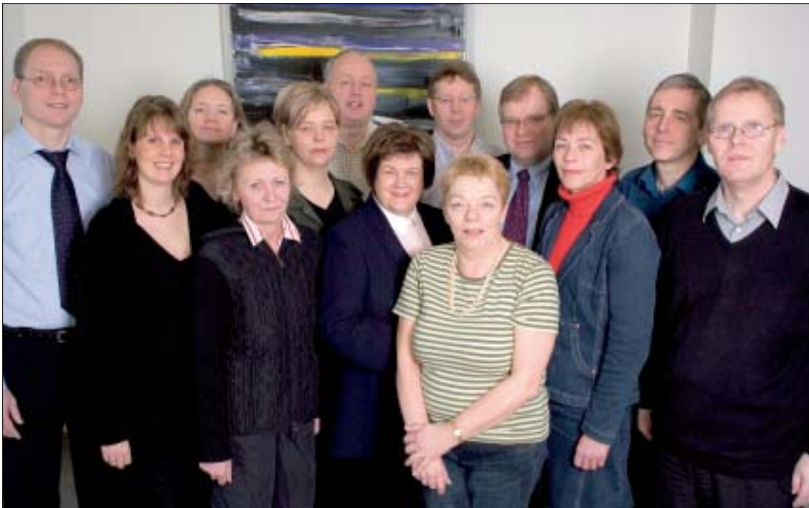
Hluti starfsfólks Ríkisendurskoðunar á góðri stund