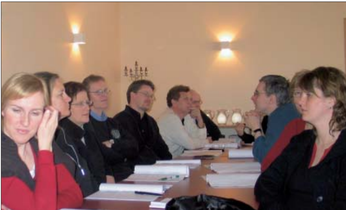
Frá starfsmannafundi í Ríkisendurskoðun

Heildargjöld Ríkisendurskoðunar árið 2006 voru 402 m.kr. samanborið við 376 m.kr. árið 2005. Þetta er um 6,9% hækkun. Sértekjur námu 29 m.kr. sem er 5 m.kr. lægri fjárhæð en árið á undan. Þannig námu gjöld umfram sértekjur 373 m.kr. sem er 31 m.kr. hærri fjárhæð en árið 2005 eða 9,1% hækkun. Ríkisframlag nam 393 m.kr. og var því tekjuafgangur ársins 20 m.kr. sem er 2 m.kr. betri afkoma en var árið 2005. Í árslok 2006 sýndi höfuðstóll 38,8 m.kr. afgang sem er 9,9% af fjárheimildum ársins.