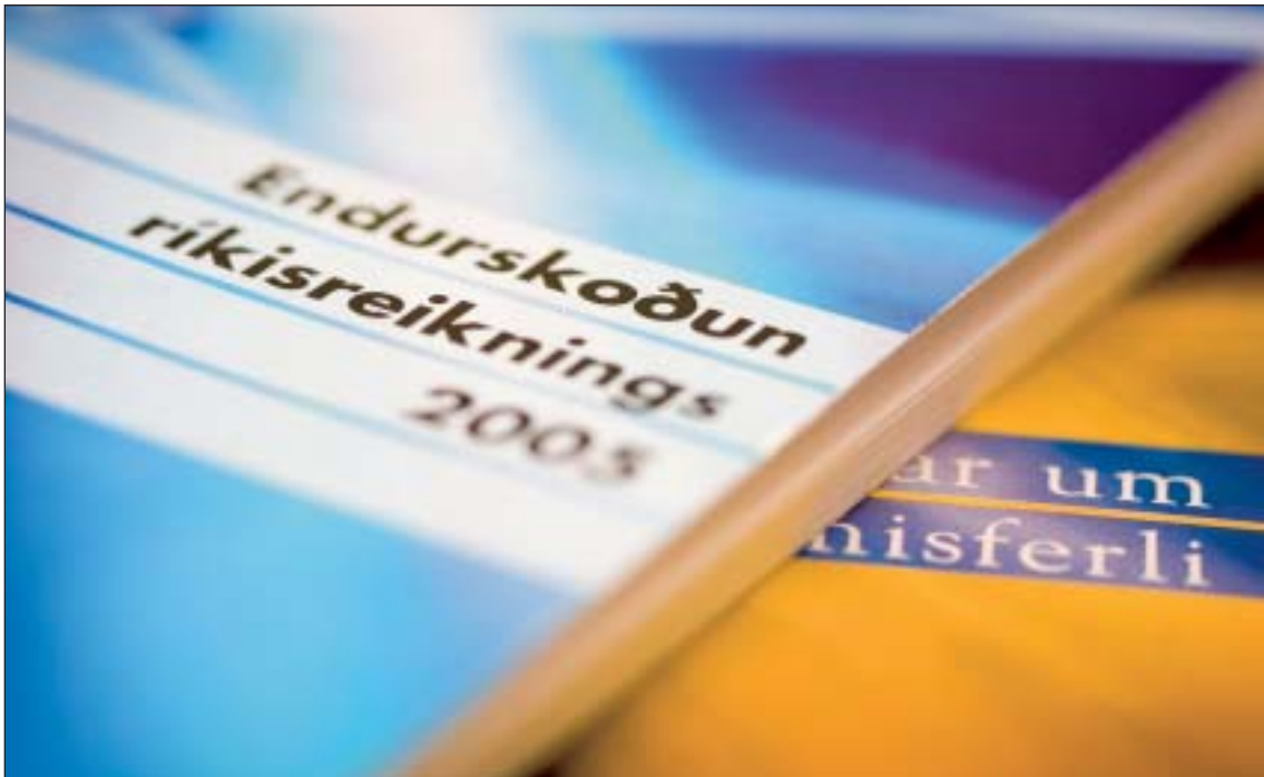
Tvö af útgáfuritum stofnunarinnar árið 2006

Á árinu 2006 voru gerðar fjölmargar breytingar á heimasíðunni til að auðvelda fötluðum að notfæra sér það efni sem þar er birt. Í tengslum við þær breytingar mótaði stofnunin sér einnig aðgengisstefnu fyrir fatlaða og birti hana meðal stefnumála sinna. Nær allt efni á vef Ríkisendurskoðunar stenst nú þær viðmiðunarkröfur um aðgengismál sem alþjóðlegi vinnuhópurinn Web Content Accessibility Guidelines Working Group hefur sett fram í staðlinum WCAG 2.0 af gerð A. Þetta þýðir að hann er meðal annars aðgengilegur blindum sem nýta sér heimasíður með hjálp skjálesara, sjónskertum sem þurfa sérstaklega stórt letur, lesblindum sem hentar annar bakgrunnur en venja er að nota og hreyfihömluðum sem eiga erfitt með að nota mús við að ferðast um vefsíður. Gera má ráð fyrir að mörg þessara atriða auðveldi einnig öldruðum að nýta sér vef stofnunarinnar.