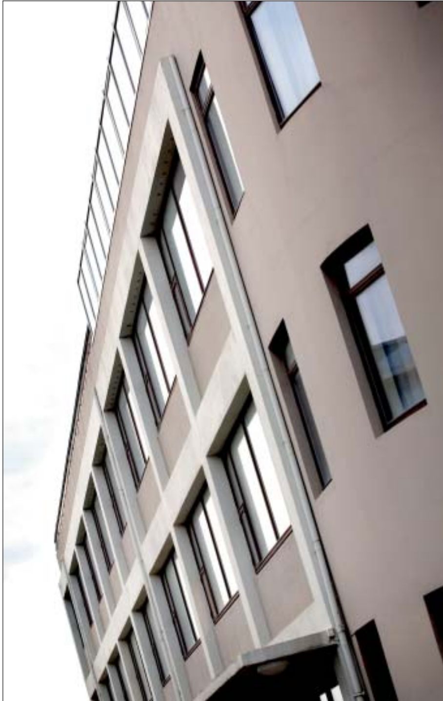
Ríkisendurskoðun Skúlagötu 57