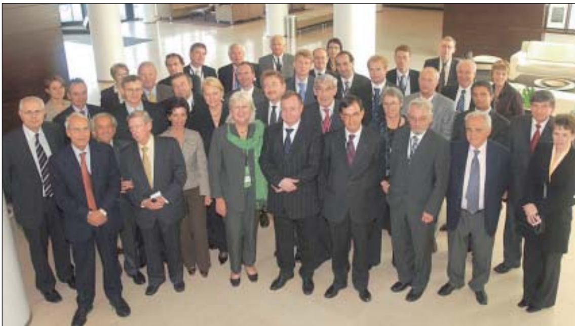
Frá XXXI. stjórnarfundu EUROSAI í Reykjavík 2006

Af norrænu samstarfi má einkum geta árlegs vinnufundar norrænna ríkisendurskoðenda og samstarfsfulltrúa stofnananna í Stokkhólmi dagana 27. til 29. ágúst. Þá sóttu þrír