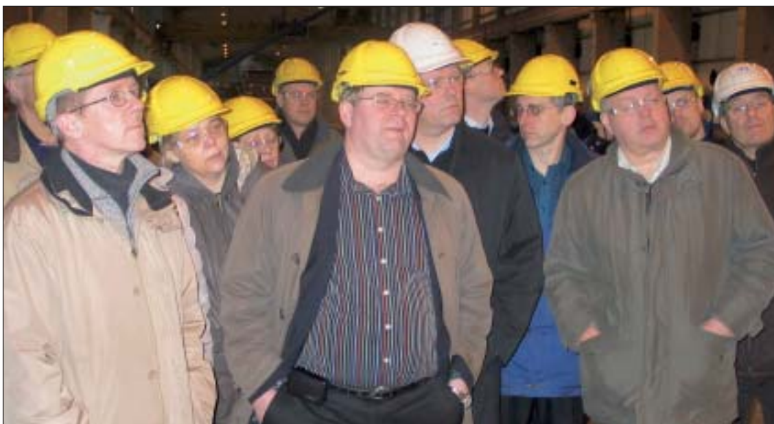
Starfsfólk Ríkisendurskoðunar í skoðunarferð