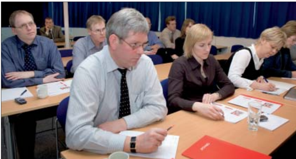
Starfsfólk Ríkisendurskoðunar á námskeiði

Starfsfólk Ríkisendurskoðunar skilaði um 1.400 færri virkum vinnustundum við endurskoðun árið 2006 en árið 2005 en um 700 fleiri en árið 2004. Þá var aðkeypt þjónusta álíka mikil og undanfarin ár. Sá auður sem felst í vinnustundum hefur því hvorki aukist né rýrnað svo nokkru nemur. Enn vantar þó tæp tvö ársverk upp á að stofnunin nái að skila jafnmörgum vinnustundum og árið 2003 (76.440).